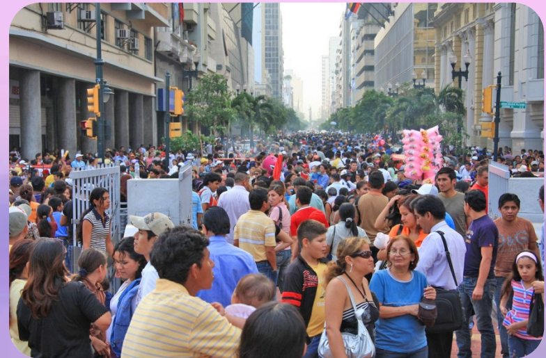
ประชากรในกรุงบราซิลเลีย ประเทศบราซิล

2.2 เขตที่มีประชากรอาศัยอยู่เบาบาง เช่น บริเวณลุ่มน้ำแอมะซอน เขตแห้งแล้งกึ่งทะเลทรายบริเวณที่ราบสูงปาตาโกเนีย เขตแห้งแล้งบริเวณทะเลทรายอาตากามา