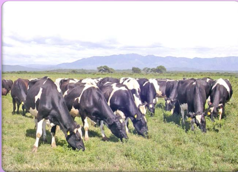
โคนม ประเทศอาร์เจนตินา

ทวีปอเมริกาใต้มีทุ่งหญ้าอุดมสมบูรณ์ เหมาะสำหรับการเลี้ยงสัตว์ เช่น ทุ่งหญ้ายาโน ทุ่งหญ้างัมโป ทุ่งหญ้า กรันซาโก การเลี้ยงสัตว์ที่สำคัญ คือ โคเนื้อ โคนม แกะ และสุกร