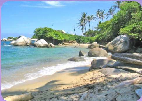
อุทยานแห่งชาติไทโรน่า ประเทศโคลอมเบีย