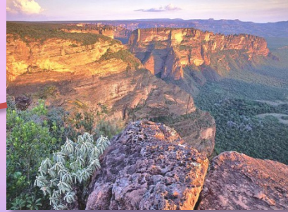
ที่ราบสูงมาตุโกรสซุ