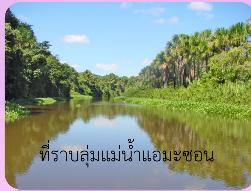
ที่ราบลุ่มแม่น้ำแอมะซอน