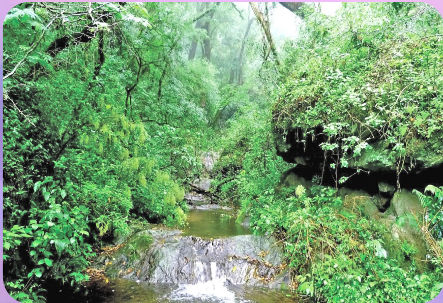
ป่าเซลวาสบริเวณลุ่มน้ำแอมะซอน

แหล่งป่าไม้ที่สำคัญ คือ ป่าดิบหรือป่าเซลวาสในบริเวณลุ่มแม่น้ำแอมะซอน ทางตอนเหนือของประเทศบราซิล ประเทศที่ผลิตไม้และมีผลผลิตจากป่าไม้ที่สำคัญ ได้แก่ ประเทศบราซิล โคลอมเบีย และเปรู