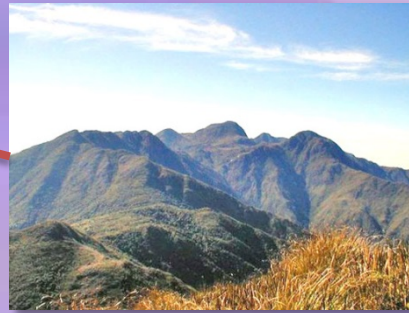
ที่ราบสูงบราซิล