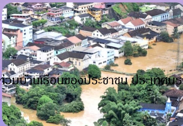
น้ำท่วมบ้านเรือนของประชาชน ประเทศบราซิล