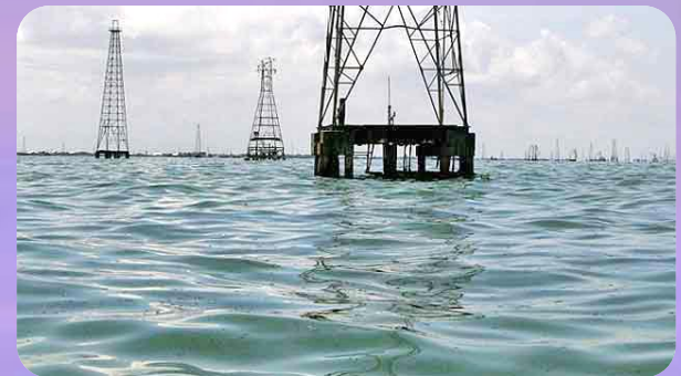
การขุดเจาะน้ำมันดิบในทะเลสาบมาราโกโบประเทศเวเนซุเอลา