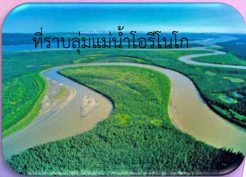
ที่ราบลุ่มแม่น้ำโอรีโนโก