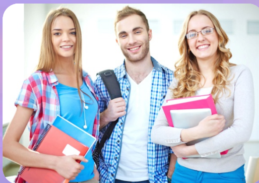
กลุ่มผิวขาว