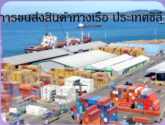
การขนส่งสินค้าทางเรือ ประเทศชิลี