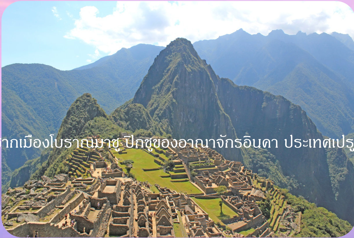
ซากเมืองโบราณมาชูปิกชูของอาณาจักรอินคา ประเทศเปรู