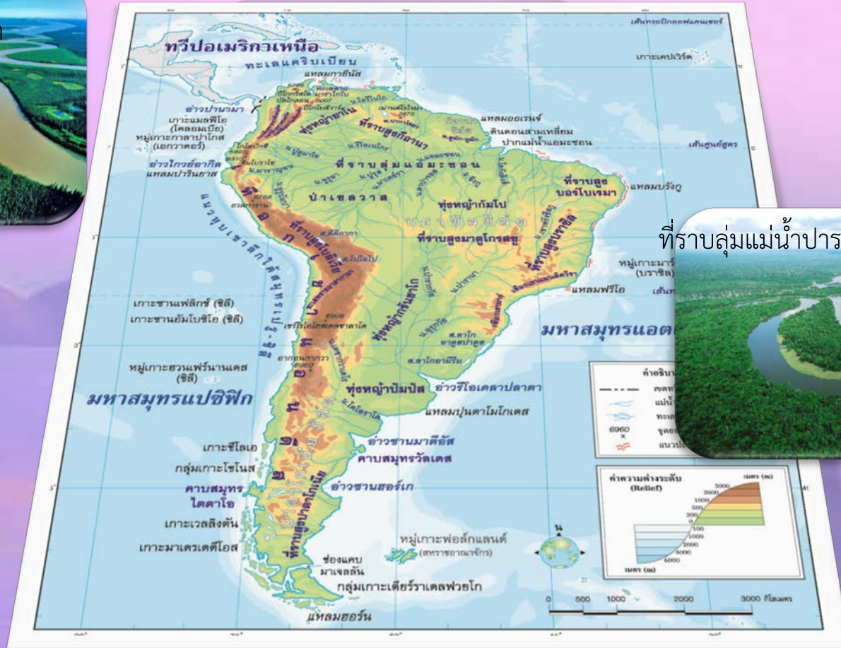
ที่ราบลุ่มแม่น้ำปารานา-ปารากวัย-อูรุกวัย