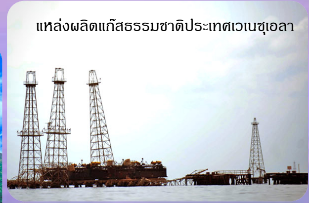
แหล่งผลิตแก๊สธรรมชาติประเทศเวเนซุเอลา