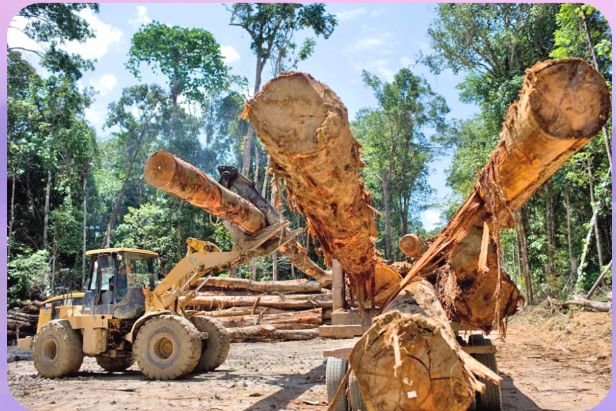
การทำป่าไม้ประเทศบราซิล