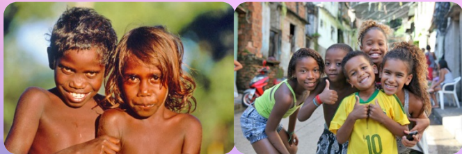
กลุ่มผิวดำ