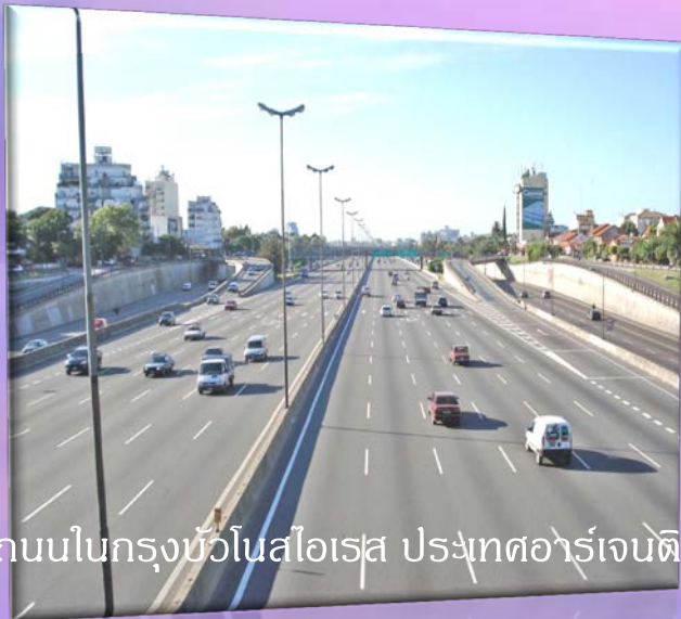
ถนนในกรุงบัวโนสไอเรส ประเทศอาร์เจนตินา

1. ทางบก เส้นทางคมนาคมขนส่งทางบกในทวีปอเมริกาใต้ยังขาดการเชื่อมโยงและขาดโครงข่ายที่เป็นระบบ การกระจายของเส้นทางคมนาคมไม่ครอบคลุมในทุกพื้นที่ จะกระจุกอยู่ตามเมืองหลวง เมืองอุตสาหกรรม และเมืองทำการที่สำคัญ