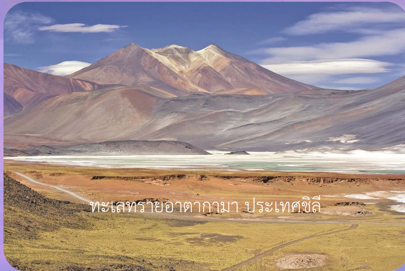
ทะเลทรายอาตากามา ประเทศชิลี