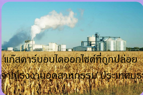
แก๊สคาร์บอนไดออกไซด์ที่ถูกปล่อย