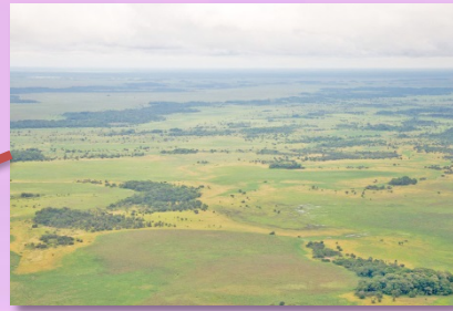
ที่ราบสูงกีอานา