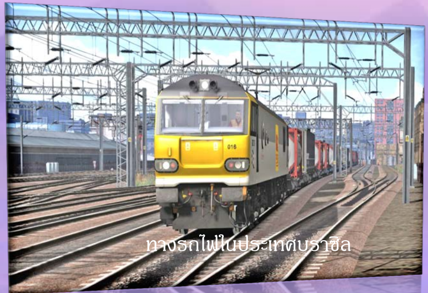
ทางรถไฟในประเทศบราซิล