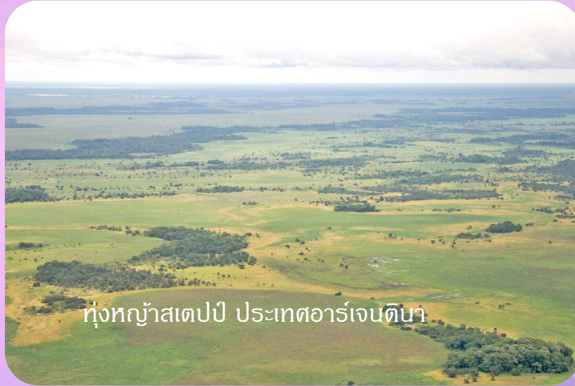
ทุ่งหญ้าสเตปป์ ประเทศอาร์เจนตินา