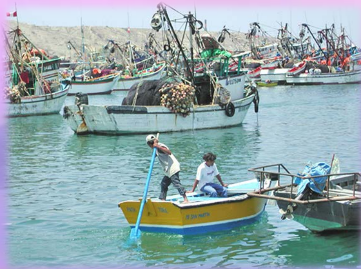
ประมงบริเวณชายฝั่งมหาสมุทรแปซิฟิกของประเทศเปรู

ทวีปอเมริกาใต้สามารถจับปลาได้รอบทวีป โดยแหล่งประมงที่สำคัญ คือ ชายฝั่งประเทศเปรูและชิลี ซึ่งเป็นแหล่งที่มีปลาชุกชุม เนื่องจากเป็นบริเวณที่กระแสน้ำอุ่นแถบศูนย์สูตรไหลมาบรรจบกับกระแสน้ำเย็นเปรู จึงทำให้มีแพลงก์ตอนซึ่งเป็นอาหารปลาอยู่เป็นจำนวนมาก